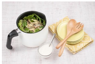
焼ききのこのこのサラダ ～ヨーグルトドレッシング～