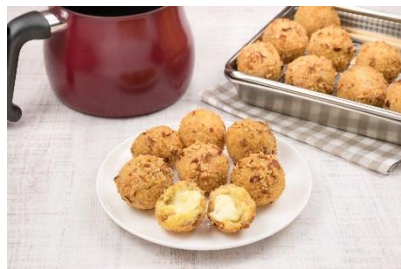
さつまいものコロコロクック

家族の健康を気遣う方にぴったりな、季節の野菜をたっぷり使った簡単レシピをHPで公開中です。レシピごとに食材の効能や栄養効率UPのポイントも紹介しています。レシピページは こちら です。 ※下記レシピ名をクリックすると、レシピページにとびます