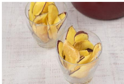
ハニーバターのおさつチップス