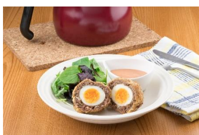
春キャベツと新玉ねぎの スコッチエッグ