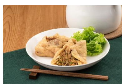
油揚げde野菜たっぷりミニ春巻き