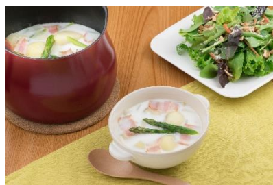
新玉ねぎとベーコンの ミルクスープ

家族の健康を気遣う方にぴったりな、季節の野菜をたっぷり使った簡単レシピをHPで公開中です。レシピごとに食材の効能や栄養効率UPのポイントも紹介しています。レシピページは こちら です。